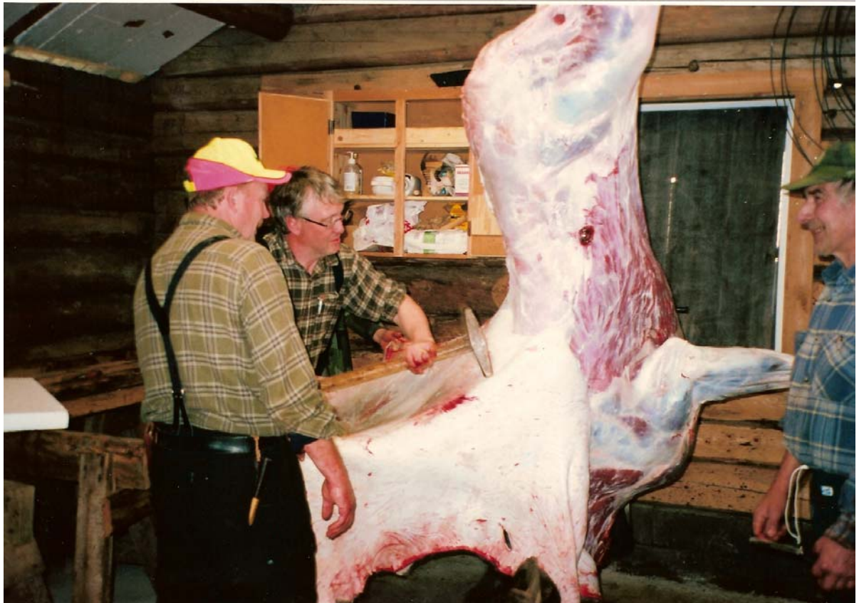
Da de var færdig med at ordne tyren blev den hejst op til loftet, hvor den skulle hænge og modne til lørdag.